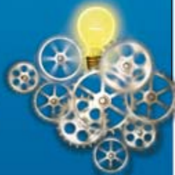
Actividad cerebral más elevada