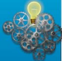
Actividad cerebral elevada