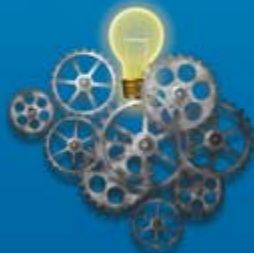
Actividad cerebral elevada

En los últimos años, nuevos estudios de neuroimagen han demostrado que el cerebro mantiene un elevado nivel de actividad incluso cuando se encuentra “en reposo”. De hecho, la lectura u otras tareas rutinarias requieren una mínima energía adicional, incrementándose en menos de un 5 por ciento sobre la que ya se consumía en el estado basal, intensamente activo.