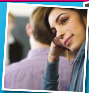
Inactivo, como cuando se sueña despierto

Al principio, la tomografía de emisión de positrones o la resonancia magnética funcional, técnicas inocuas, no captaban signos de actividad basal en el cerebro cuando el individuo se encontraba en reposo. Aportaban, pues, una imagen incorrecta de la actividad nerviosa.